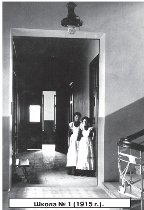
Школа № 1 (1915 г.).