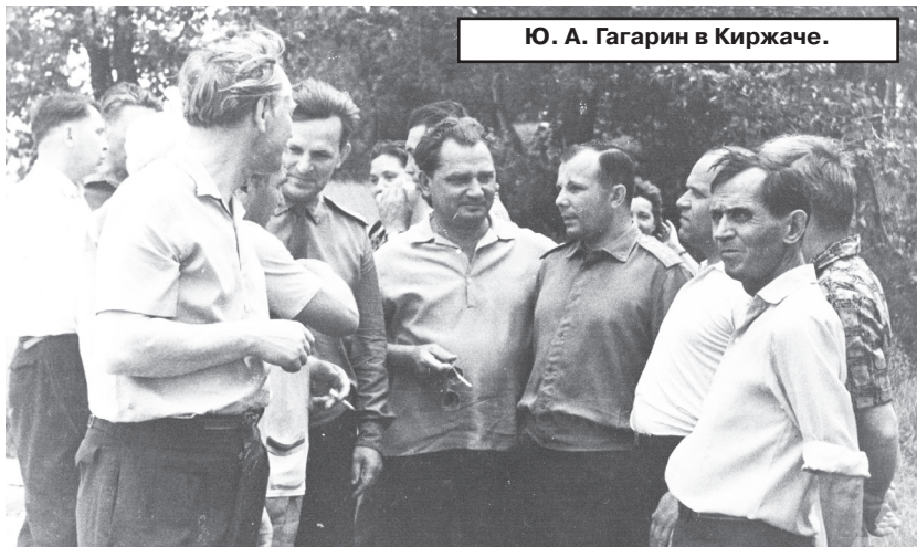
Ю. А. Гагарин в Киржаче.