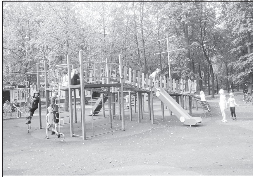
Сквер им. Ленина (мкр. шёлкового комбината).

– В прошлом году стало известно, что будет благоустроиваться территория шёлкового комбината, а сам он подвергнется реконструкции. В конце апреля снова прошла информация об этом. На какой стадии находится работа в этом направлении сейчас?