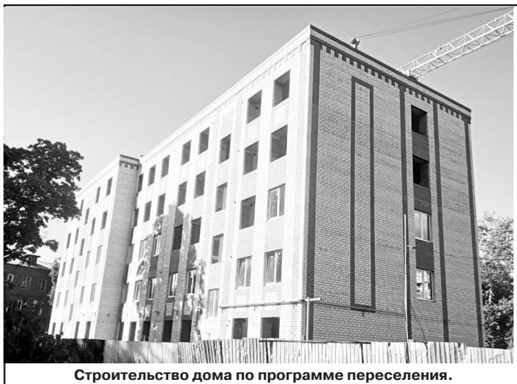
Строительство дома по программе переселения.