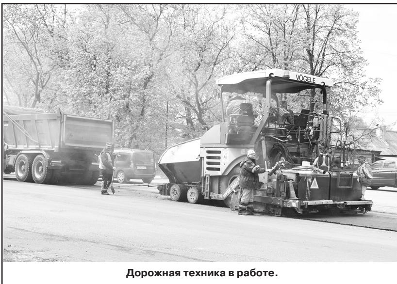
Дорожная техника в работе.

– С отменой ограничений снова проводятся культурные и спортивные мероприятия. У нас в городе вернулись к их прежнему масштабу?