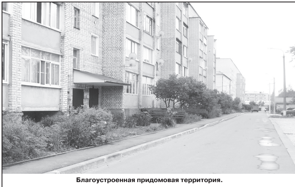
Благоустроенная придомовая территория.