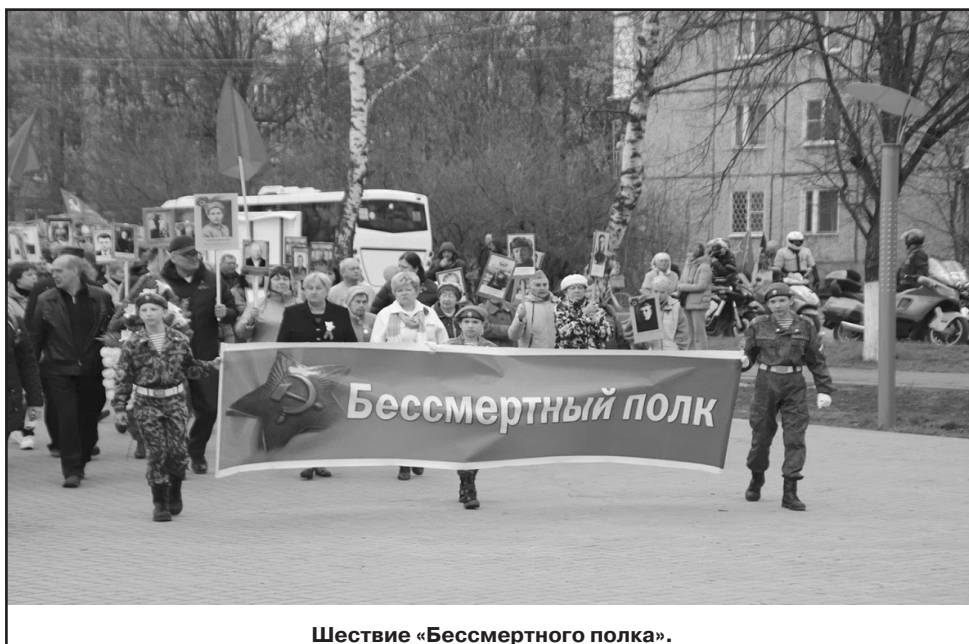
Шествие «Бессмертного полка».