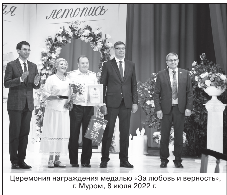
Церемония награждения медалью «За любовь и верность», г. Муром, 8 июля 2022 г.

Поддержка и защита института семьи является одним из наиболее важных направлений социальной политики Российской Федерации. Семья, материнство, отцовство и детство - ключевые объекты социальной помощи, поскольку от благополучия каждой семьи зависит общее благосостояние нашего общества.