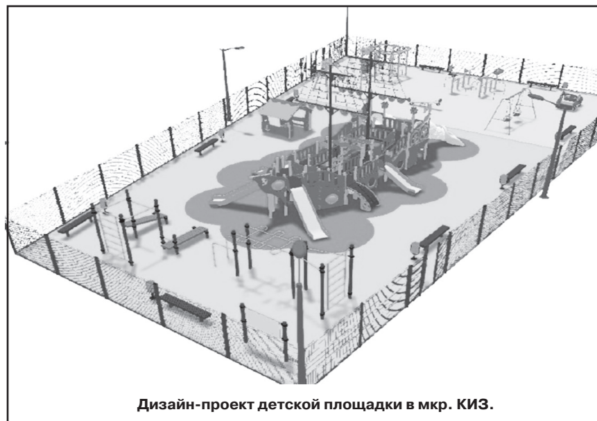
Дизайн-проект детской площадки в мкр. КИЗ.