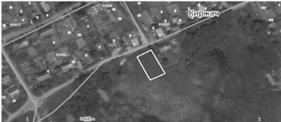
Земельный участок, находящийся на территории города Киржач, в кадастровом квартале 33:02:010801:

Земельный участок, находящийся на территории города Киржач, в кадастровом квартале 33:02:010633: