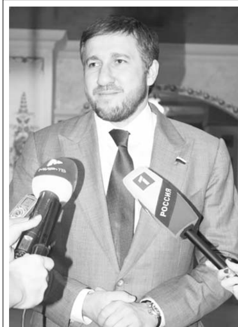
Депутат Госдумы Григорий Аникеев: «Работа с детьми - одно из приоритетных направлений нашей деятельности».

Ребята остались в восторге от спектакля. Встреча с Дедом Морозом подарила всем собравшимся замечательные впечатления и хорошее настроение. А маленькие гости получили новогодние подарки.