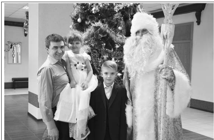
В этом году в новогодних елках примут участие более 2000 детей региона.

Долгожданная встреча с Дедом Морозом и Снегурочкой, новогодние представления.