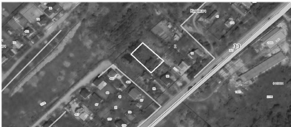
Земельные участки, находящиеся на территории города Киржач, мкр. Красный Октябрь, в кадастровом квартале 33:02:020503: