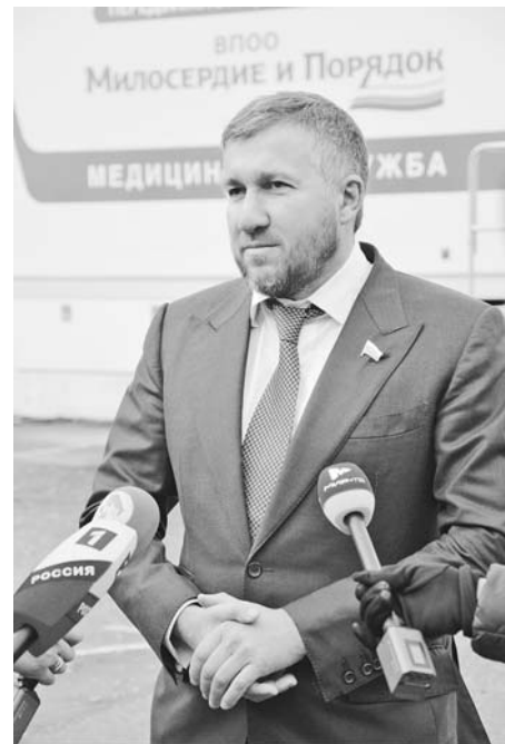
Депутат Госдумы Григорий Аникеев: «Наш проект доказал, что при поддержке людей можно эффективно решать многие вопросы, касающиеся здоровья земляков».