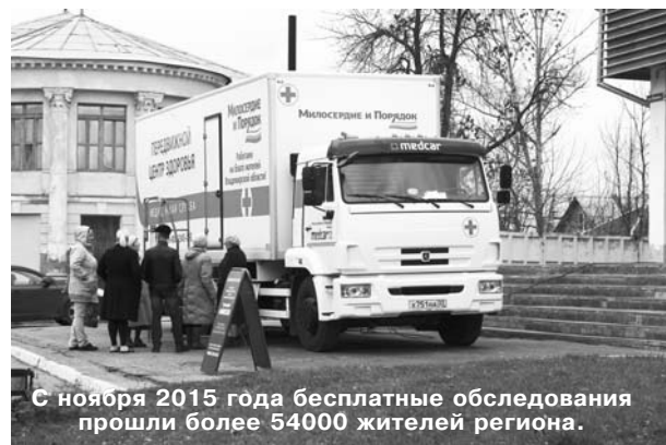
С ноября 2015 года бесплатные обследования прошли более 54000 жителей региона.

В сфере межбюджетных отношений предусматривается реализация комплекса мер, направленных на стабильность финансовой поддержки муниципальных образований поселений. Предлагается сохранить 2 вида межбюджетных трансфертов (дотации на выравнивание бюджетной обеспеченности, иные межбюджетные трансферты на сбалансированность бюджетов поселений).