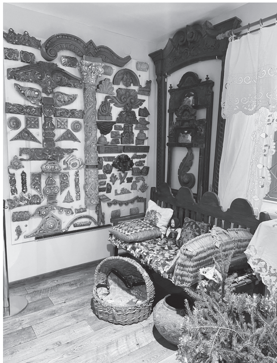
НА СНИМКАХ: в экспозиции «Крестьянский быт»; знакомство с купеческим бытом; экспозиция «Мастерская плотника-аргуна».

Пушкинская карта – это государственная программа приобщения молодежи к культуре, важный культурно-образовательный проект. Принять участие в программе могут молодые люди от 14 до 22 лет.