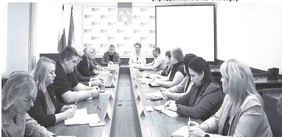
НА СНИМКЕ: на планерке. (Продолжение на 4-й стр.)

Глава администрации МО Першинское поднял и наболевшие вопросы. В частности, о передаче котельной п/о Дубки в УМПП ЖКХ МО Першинское и об установлении тарифа на ее содержание и ремонт. В тарифе обслуживание и ремонт котельной не заложены, а значит, нет и средств на подготовку ее к