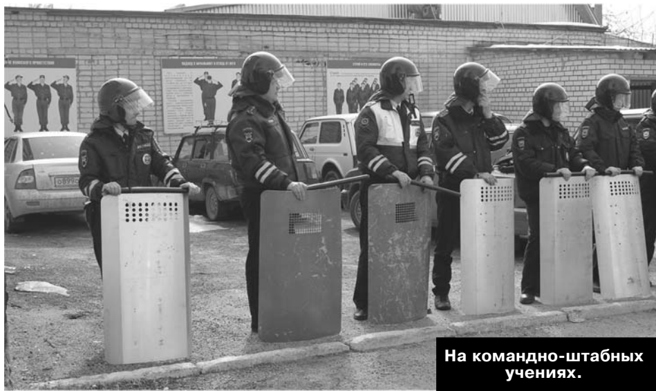
На командно-штабных учениях.

Вы же наверняка слышали о том, что в прошлом году в г. Александрове был случай, когда взяли террористов. Совсем недавно операцию по задержанию террористов производили в Кольчугино. Да, мы участвовали в этих операциях, но не на первых позициях. Операции - это разработка сотрудников ФСБ России. Была получена информация, что два террориста-смертника готовят теракт. Сотрудниками ФСБ России совместно с сотрудниками МВД России были проведены мероприятия по задержанию данных лиц, однако они оказали сопротивление, после чего и были ликвидированы. В самом задержании мы не участвовали, прикрывали возможные пути отхода преступников на границе между Александровом и Киржачом. В доме тогда нашли оружие и взрывчатые вещества. Если бы сотрудники ФСБ вовремя не выявили этот факт, теракт мог состояться. Где и когда - скорее всего, не знали и сами смертники. Им сообщают об этом в последний момент. У террористов тоже четко отлаженная система работы как по организации преступлений, так и по вербовке граждан. Они неплохие психологи. Играют на чувствах патриотизма, на мусульманской вере. Обычно под их влияние попадают молодые люди, не устроенные в этой жизни. Как говорят сами мусульмане, в Коране не написано того, что пытаются внушить боевики завербованным гражданам. С ними работают очень сильные психологи.