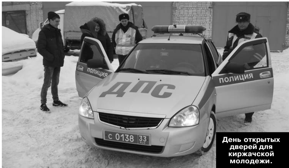
День открытых дверей для киржачской молодежи.