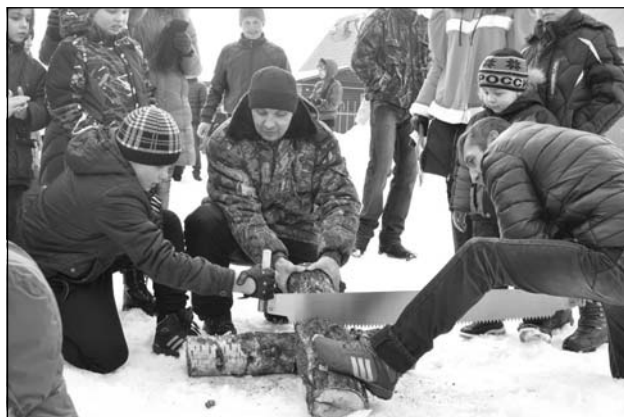
«Зареченский СДК» и МКУ «Песьяновский СДК».