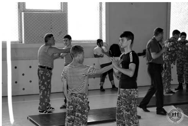
Фото В. Ладыгина.

Пресс-служба ГУВД МВД по Владимирской области.