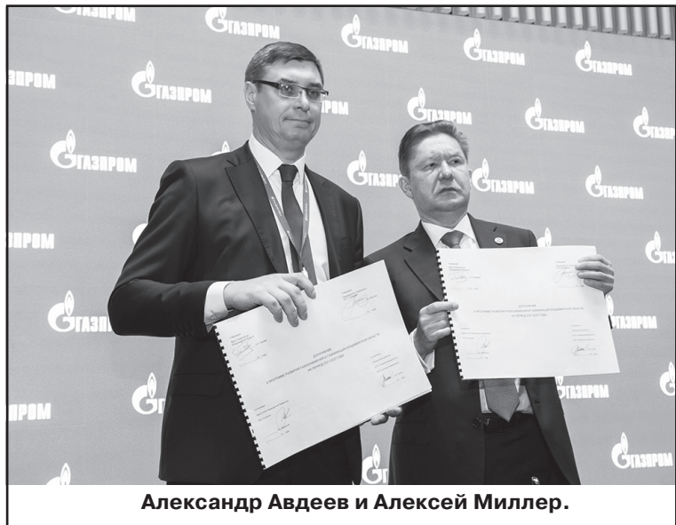
Александр Авдеев и Алексей Миллер.

Об этом 17 июня на Петербургском международном экономическом форуме договорились глава региона Александр Авдеев и председатель Правления ПАО «Газпром» Алексей Миллер.