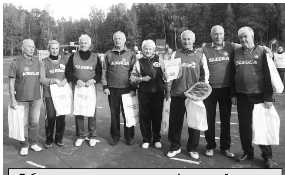
Победители – команда ветеранов физической культуры и спорта «Высшая лига».