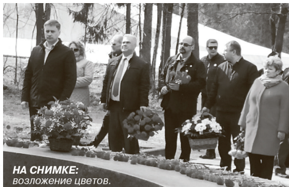
НА СНИМКЕ: возложение цветов.

27 марта – печальный день в истории космонавтики, когда завершилась земная жизнь первого космонавта планеты Ю. А. Гагарина. В этот день обычно на место гибели Ю. А. Гагарина и В. С. Сергина приезжают сотни людей из разных областей, чтобы почтить память героев. Но в этом году в связи с пандемией митинг пришлось отменить. Состоялось лишь возложение цветов к памятнику.