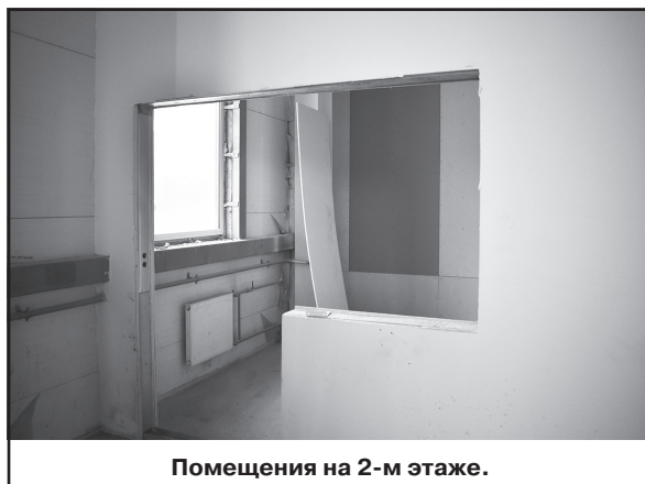
Помещения на 2-м этаже.

- После пуска котельной мы выйдем на финишную прямую и приступим к отделочным работам внутри ФОКа, - говорил главе С. В. Коротков. - А после отделки стен приступим к укладке потолка.