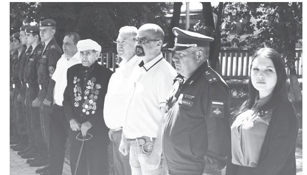
НА СНИМКЕ: участники церемонии.

В июне полным ходом шло обсуждение поправок к Конституции РФ. Голосование по поправкам проходило с соблюдением необходимых санитарно-эпидемиологических норм и требований.