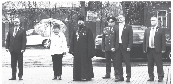
НА СНИМКЕ: поздравление с Днем Победы.

В непростое время пандемии киржачские волонтеры были на передовых позициях и помогали не только киржачанам, но и нашим соседям – жителям Петушинского района, где в майские дни оказывали помощь в организации контрольно-пропускного пункта в режиме комплексно-ограничительных мероприятий.