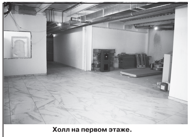
Холл на первом этаже.