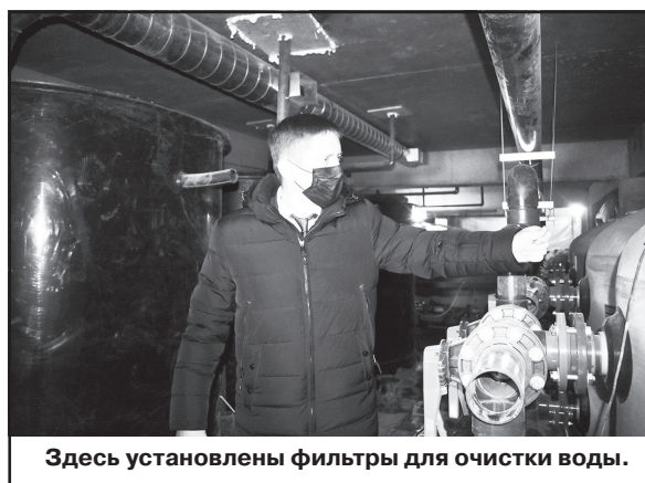
Здесь установлены фильтры для очистки воды.

- Основные работы завершены на средства, предоставленные правительством Москвы, - говорил он. - Продолжение и окончание работ будет проведено за счет средств муниципального района.