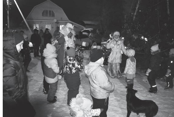
А. СТАРУН. НА СНИМКАХ: праздничные моменты.

Завершалось каждое мероприятие поздравлением с наступающим Новым годом от депутатов городского Совета народных депутатов. А напоследок Дед Мороз и Снегурочка раздавали ребятам сладкие подарки.