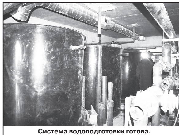
Система водоподготовки готова.

- После того, как будет пущен газ в котельную и тепло