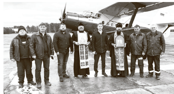
НА СНИМКЕ: перед полетом над Киржачским районом.

Также священнослужители совершили облет Киржачского района на самолете с иконами Божией Матери «Скоропослушница» и апостола Андрея Первозванного и молились об избавлении жителей района и всей страны от эпидемии коронавируса.