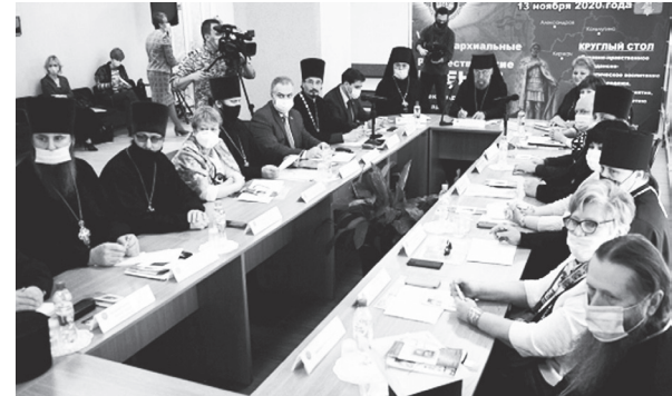
НА СНИМКЕ: участники круглого стола. ДЕКАБРЬ