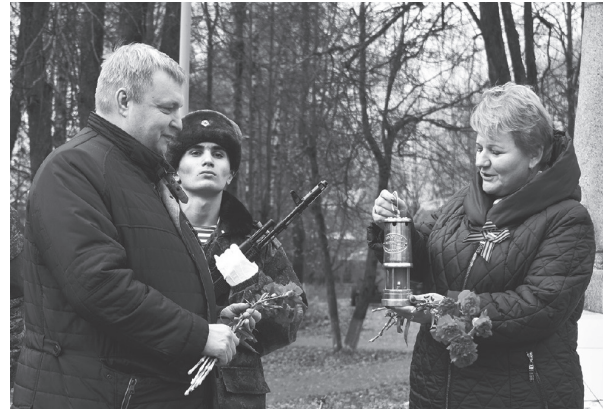
НА СНИМКЕ: передача капсулы. ОКТЯБРЬ

Вечный огонь побывал практически во всей Владимирской области, в середине октября из Петушков добрался до нашего района и был передан представителям Александровского района.