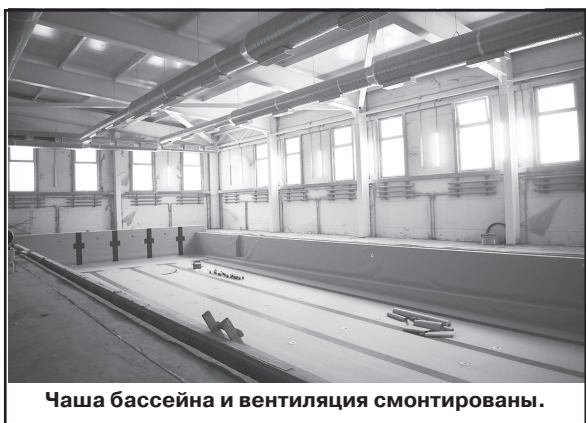
Чаша бассейна и вентиляция смонтированы.

- По наружному освещению, если, как и обещали поставщики, столбы привезут 31 декабря, - ответил ему подрядчик, - мы сразу после праздника начнем установку мачт. Фундамент под столбы уже сделан, залит бетоном, электрика подведена. Подготовительные работы под отделку помещений тоже завершаются, работали при тепловых пушках, нагоняли температуру до необходимых 12 градусов. Сейчас стены практически готовы к чистой отделке.