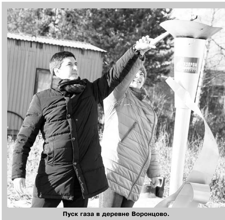
Пуск газа в деревне Воронцово.

Крупнейшая электросетевая компания региона – «Владимирэнерго», имеет в работе более 22 тыс. км электрических сетей и 5 тыс. трансформаторных подстанций. Между администрацией Владимирской области и ПАО «Россети» действует Соглашение о сотрудничестве для обеспечения надёжного и бесперебойного электроснабжения потребителей и консолидации электросетевого комплекса 33-го региона.