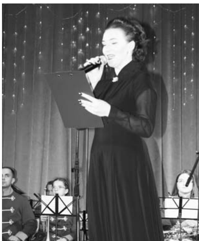
Академический хор «КиржЭль» также один из молодых коллективов прочно занявших место на сценических площадках не только Киржача. Он