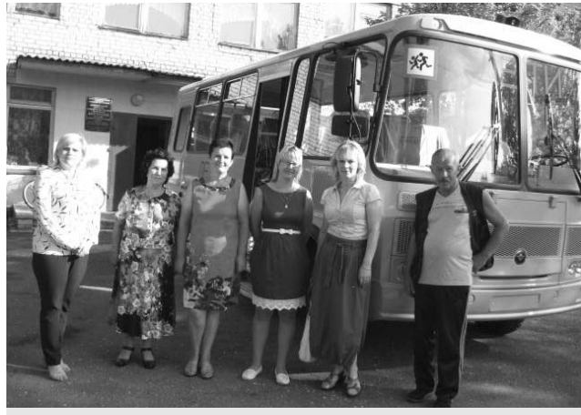
Часть коллектива Данутинской школы у нового автобуса.

- Еще не так давно практически все сельские школы региона испытывали с кадрами сложности. Мало кто соглашался стать подвижником и за небольшую зарплату работать вдали от центров культуры, жить в домах, порой не оборудованных коммунальной инфраструктурой. И только политика руководства области, направленная на привлечение выпускников училищ и вузов в село, на улучшение жизни сельчан вообще, смогла несколько исправить ситуацию.