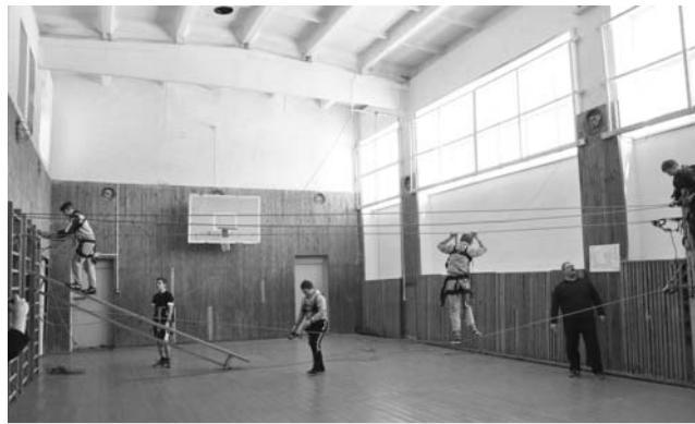
На занятии туристического кружка в отремонтированном спортзале.

СПРАВОЧНО: на развитие сферы образования за 5 лет направлено 2 млрд. 371 млн. руб. Для сравнения: в 2013 г. - 412,5 млн. руб., в 2017 г. - 589,5 млн. руб. (рост на 42,9%), в 2018 г. запланировано 559,4 млн. руб. Отремонтированы спортивные залы в 5 общеобразовательных школах, а в 4 школах построены открытые спортивные площадки.