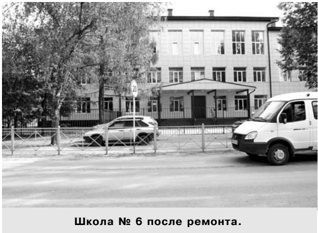
Школа № 6 после ремонта.