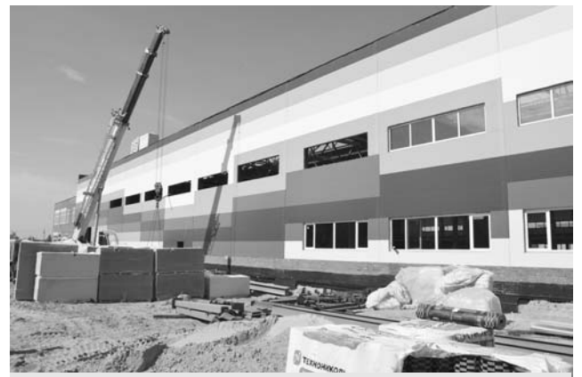
Строятся новые цеха НПО «Наука».