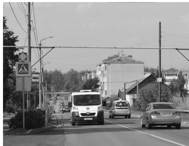
Пешеходный светофор перед школой № 7.

Обратите внимание и на город. Пять лет назад проехать по Киржачу было почти невозможно. Все мы помним митинги против плохих дорог. Сейчас это хорошие добротные дороги с надлежащей разметкой и дорожными знаками. Появились новые светофоры и даже пешеходные светофоры, которые устанавливаются около детских учреждений. Одеты в асфальт и самые дальние дороги, которые капитально не ремонтировались около 30 лет - такие, как ул. Мичурина. Заасфальтирована и сделана пешеходной зоной центральная площадь Киржача. Она стала более уютной и комфортной. Во многих микрорайонах стали строиться тротуары. Грейдируются даже грунтовые дороги в частном секторе.