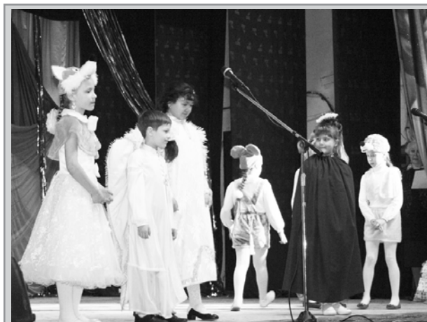
Рождественская история от воспитанников Воскресной школы Свято-Благовещенского монастыря.

В завершение праздника Дедушка Мороз подарил детям подарки и сладкие гостинцы. Все участники праздника сфотографировались на память.