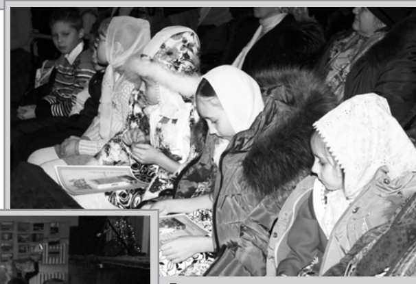
Дети с заслуженными наградами.