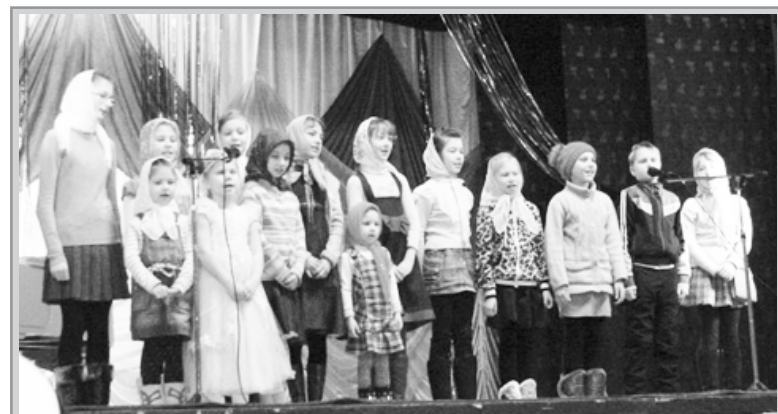
Выступают воспитанники Воскресной школы п. Горка.