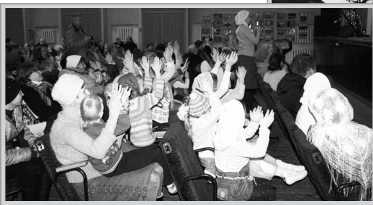
Зрители аплодисментами поддерживают артистов.