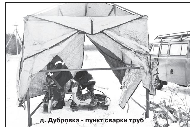
д. Дубровка - пункт сварки труб