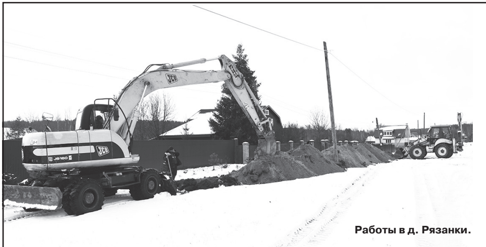
Работы в д. Рязанки.

Глава администрации МО Горкинское, его заместитель и подрядчик рассматривают проект.