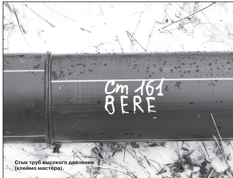
Стык труб высокого давления (клеимо мастера).