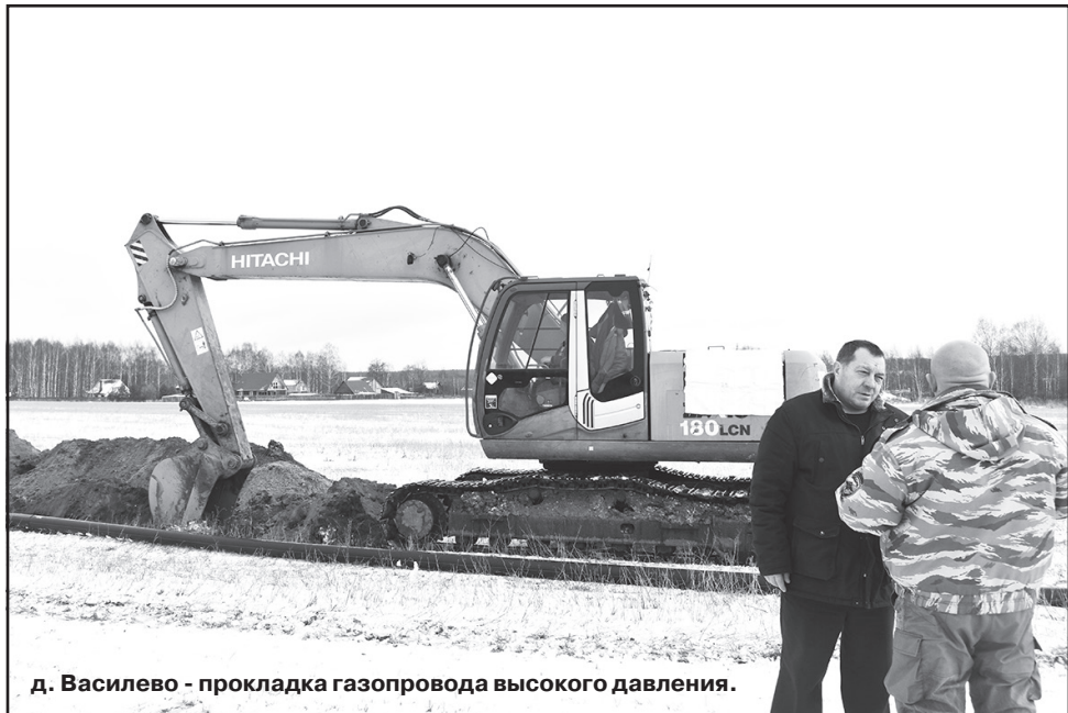
д. Василево - прокладка газопровода высокого давления.

Также в рамках данной программы планируется строительство двух блочно-модульных котельных в п. Горка, одна