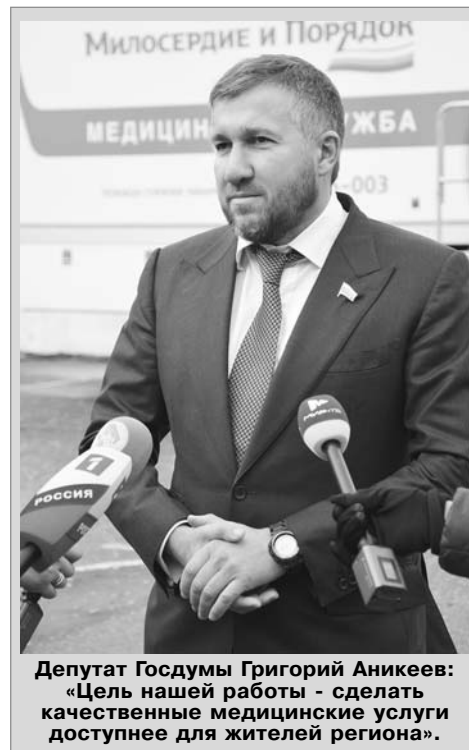
Депутат Госдумы Григорий Аникеев: «Цель нашей работы – сделать качественные медицинские услуги доступнее для жителей региона».

в группах в социальных сетях. Записаться к врачу можно заранее по телефону бесплатной горячей линии: 8 (800) 234-5 0-03.