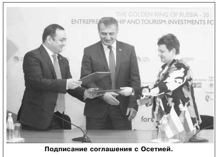
Подписание соглашения с Осетией.

И еще одной площадкой форума стал Ковров, где на базе ООО «Первый клини-