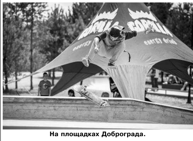
На площадках Доброграда.

держке губернатора Владимирской области Светланы Орловой с 2014 года.