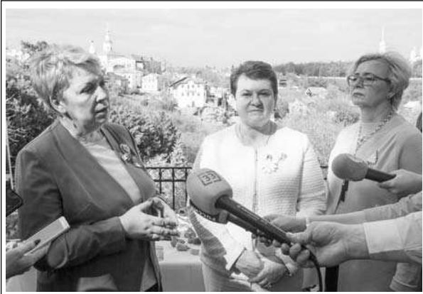
В Патриарших садах.