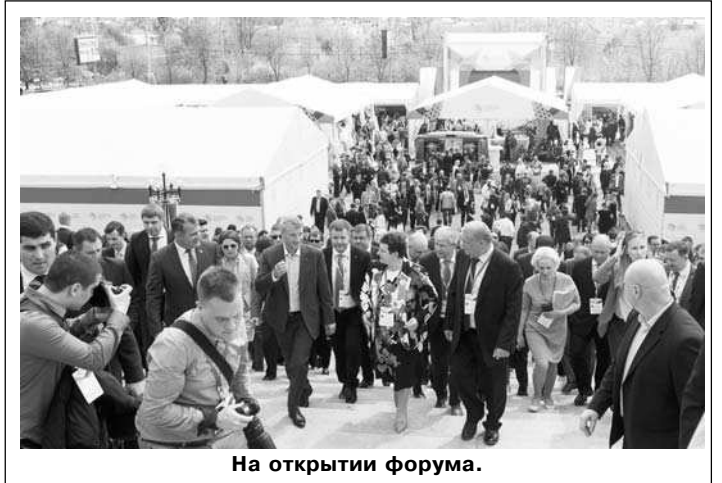
На открытии форума.

«Золотое кольцо России» - это 5 областей и 8 городов, которые ежегодно посещают 18 млн. человек.