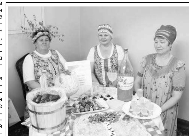
Суздаль гастрономический предлагает.

Также было отмечено, что в перечне основных мероприятий культурно-познавательного и событийного туризма 33-го региона появилось новое направление – усадебный туризм. Популяризация возрождения усадеб – одна из целей проекта «Музыкальная экспедиция», который реализуется в 33-м регионе при под-