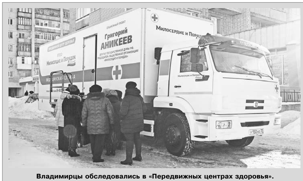
Владимирцы обследовались в «Передвижных центрах здоровья».

Ознакомиться с графиком работы «Передвижных центров здоровья» можно на официальном сайте общественной организации «Милосердие и порядок» ( vpo0-mip.ru ) и в группах в социальных сетях. Записаться к врачу можно заранее по телефону бесплатной горячей линии 8 (800) 234-50-03.