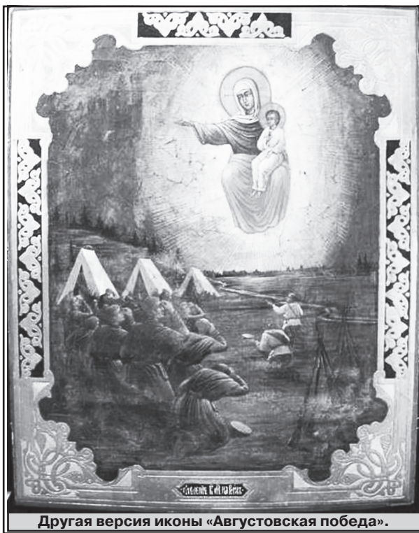
Другая версия иконы «Августовская победа».