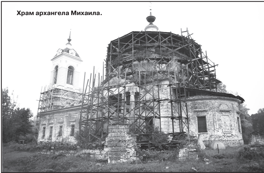
Храм архангела Михаила.

В Киржачском районе, неподалеку от д. Митино, расположился единственный в наших краях воинский храм, посвященный Архистратигу Воинства Небесного, как называют его верующие - Воинства Света, Архангелу Михаилу. Это, я бы сказала, монументальный храм в формах зрелого классицизма, который при встрече с ним впечатляет своими размерами и серьезностью. Силуэт здания определяется выразительным сочетанием массивного объема, венчающегося куполообразным сводом и стройной колокольней, по боковым сторонам храма возвышаются каменные колонны. От окружающей прямоугольный участок ограды Архангельского погоста сохранились западные и южные ворота, а также две башни на юго-западном и юго-восточном углах. Здесь нашли упокоение многие известные люди России, в том числе и генерал-лейтенант, композитор и художественный руководитель Академического ансамбля песни и пляски Российской Армии имени А. В. Александрова - Валерий Михайлович Халилов.