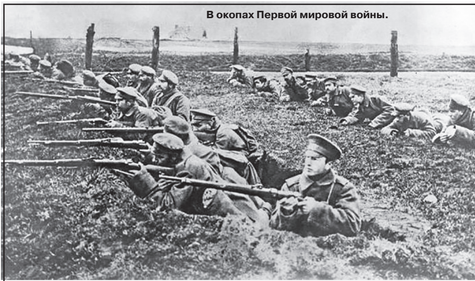
В окопах Первой мировой войны.