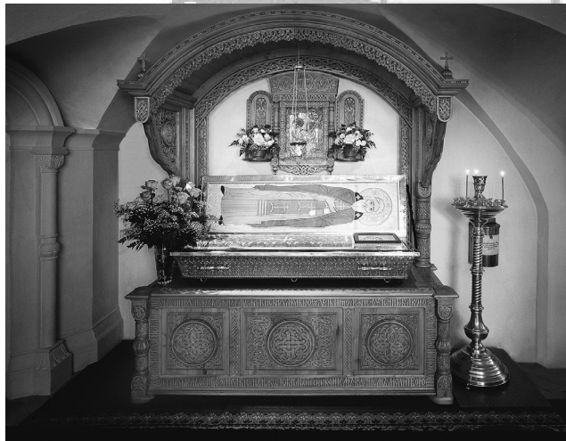
Рака с мощами преподобного Романа Киржачского в храме, освященном в его честь.

Благовещения Пресвятой Богородицы, выстроенный братией при непосредственном участии преподобного Сергия.