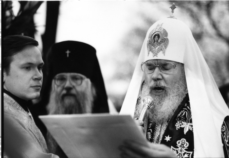
Святейший Патриарх Московский и Всея Руси Алексей II совершает молебен перед обретенными мощами преподобного Романа Киржачского. 25 ноября 1997 года

Руси Алексей II. При огромном стечении народа, свяществующих Патриарх во дворе монастыря совершил молебен преподобному Роману и благословил всех иконой святителя Иннокентия Московского, которую потом передал в дар обители. После молебна в городском Доме культуры состоялась встреча Патриарха с общественностью и жителями города.