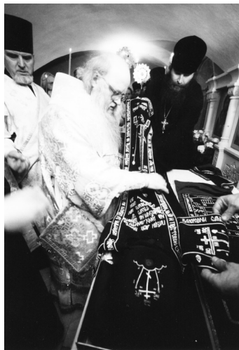
Архиепископ Владимирский и Суздальский Евлогий облачает обретенные мощи преподобного Романа Киржачского в схимнические одежды. 23 ноября 1997 года.

четверти XIV века. Церковное предание сохранило память о том, что с юных лет сердце отрока загорелось любовью ко Христу и стремлением к монашеству. Услышав о дивном Радонежском пустынноике преподобном Сергии, Роман отправился к нему на Маковец, поступил в число братии Троицкого монастыря (ныне Свято-Троицкая Сергиева лавра) и всецело предал свою волю духоносному учителю, став его послушным учеником. Согласно «Книги, глаголемой описании о российских святых» (источник XVI–XVII веков) и устойчивому устному преданию, он соотранствовал преподобному Сергию, когда тот тайно покинул Троицкий монастырь и отправился на поиск нового места для пустынножительства. Когда же на берегу реки Киржач такое место было найдено, Роман стал одним из верных помощников