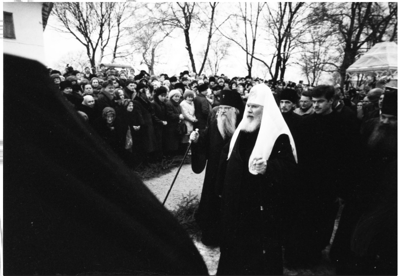
Встреча Первосвященителя на Киржачской земле. 25 ноября 1997 года.

Руси Алексей II. При огромном стечении народа, свяществующих Патриарх во дворе монастыря совершил молебен преподобному Роману и благословил всех иконой святителя Иннокентия Московского, которую потом передал в дар обители. После молебна в городском Доме культуры состоялась встреча Патриарха с общественностью и жителями города.