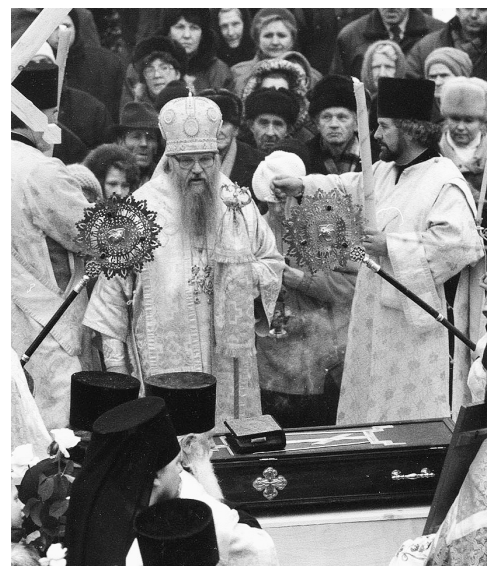
Архиепископ Владимирский и Суздальский Евлогий совершает молебен перед обретенными мощами преподобного Романа. 24 ноября 1997 года.

Для участия в праздничных торжествах в Киржач приехал Святейший Патриарх Московский и Всея