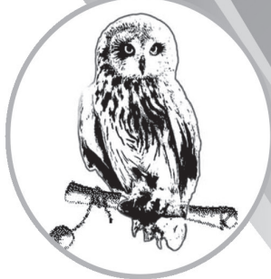
Газета основана 27 апреля 1931 года

УЧРЕДИТЕЛЬ АДМИНИСТРАЦИЯ КИРЖАЧСКОГО РАЙОНА ВЛАДИМИРСКОЙ ОБЛАСТИ