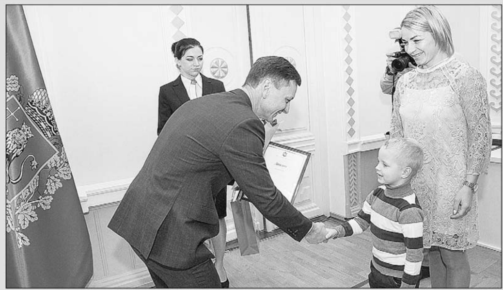
На встрече с участниками областной акции.

В 2019 году на реализацию так называемого «детского бюджета» в бюджете Владимирской области заложено более 16 млрд рублей. Эти средства будут направлены на развитие образования, строительство дошкольных учреждений и школ, детское здравоохранение, отдых и оздоровление детей, их социальную поддержку, улучшение демографической ситуации в регионе и другие направления, связанные с материнством и детством.