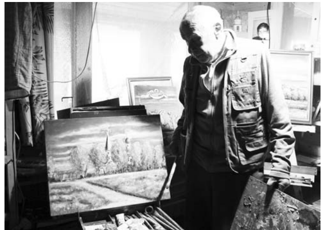
Г. КОЛЫБАНОВА, внештатный корр.

...Устроителями акции 2003 года была выполнена задача, которую возлагали на десантников партия и правительство еще в 1968 году. Было доказано, что люди способны покорять горные вершины при помощи парашютов. Правда, никто в мире, кроме русских, на такие массовые прыжки в горах до сих пор не отважился».