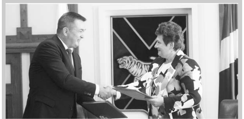
Светлана Орлова и Владимир Миклушевский подписали «дорожную карту» по реализации Соглашения о сотрудничестве между регионами, которое было заключено в 2015 году.

Хорошие перспективы межрегионального сотрудничества имеют детский отдых и туризм. Светлана Орлова достигла договоренности с руководством Приморского края о том, что ребята с Дальнего Востока приедут во Владимирскую область и побываю в Приморье и Суздали, а дети 33-го региона смогут отдохнуть во Всероссийском детском центре «Океан» на берегу Тихого