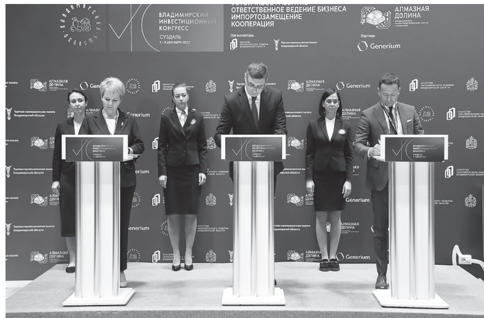
НА СНИМКЕ: подписание инвестиционного соглашения.