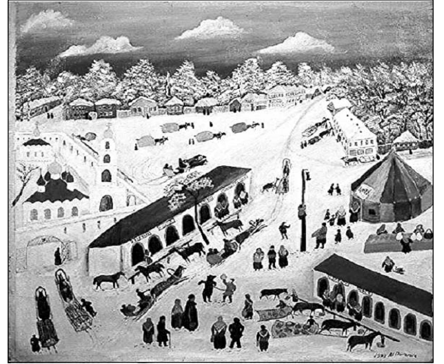
Картина В. В. Григорьева Ярмарка в Киржаче в 1929 г. (стрелка указывает на малые торговые ряды).

Но мы их видим на довольно условной картине художника найвного искусства В. В. Григорьева, который родился в г. Киржаче и большую часть жизни прожил в Москве, а также на фотографии 1953 г.