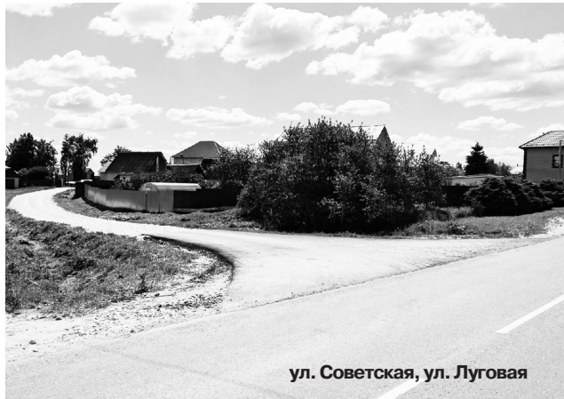
ул. Советская, ул. Луговая

Следует также отметить, что за тем, насколько качественно и своевременно идет освоение дорожных субсидий, установлен парламентский и общественный контроль. Позвонив по телефону 8-800-200-53-33 в рабочее время, можно сообщить о фактах некачественного ремонта.