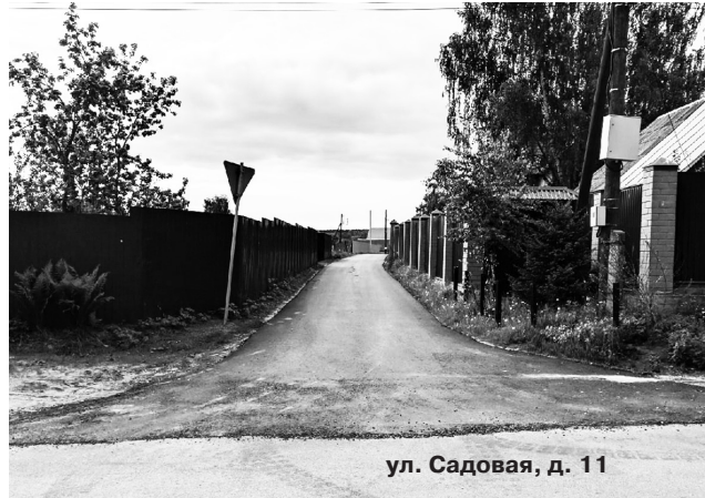
ул. Садовая, д. 11