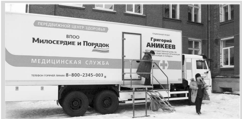
«Передвижные центры здоровья» - возможность пройти бесплатное обследование рядом с домом или работой.

в социальных сетях. Записаться к врачу можно заранее по телефону бесплатной горячей линии: 8 (800) 2345 003.