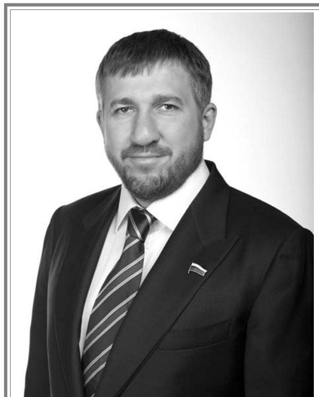
Григорий Аникеев, депутат Государственной Думы РФ: «Принципиально важно, чтобы как можно больше людей смогли получить бесплатные консультации врачей и пройти обследования» - читайте на 3-й стр.