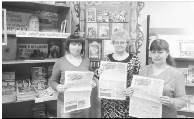
Коллектив Центральной детской и юношеской библиотеки МБУК «ЦБС» Киржачского района.

Ваш коллектив мы поздравляем с юбилеем, И слов душевных мы не пожалеем! Пусть будет коллектив могуч, Желаем вам удачи и добра, Пусть сбудется у каждого мечта!