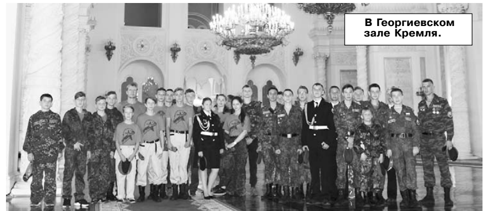
В Георгиевском зале Кремля.

Межрегиональный сбор допризывной и призывной молодежи прошел на хорошем организационном уровне и оставил у участников незабываемые впечатления. Нужно отметить, что многолетняя деятельность ОЦВПП «Фрегат» позволила приобщить к военно-патриотическому движению тысячи молодых людей, многие из которых выбрали свой правильный путь в жизни, пройдя срочную военную службу, получив профессию и заняв достойное место в нашем российском обществе, став надежными защитниками нашего Отечества - и не только в военной, но и в гражданской деятельности. А «Фрегату» хочется пожелать дальнейшего успешного движения в решении государственных задач в интересах граж-