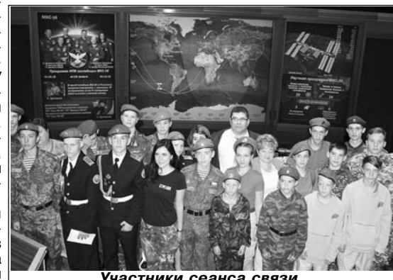
Участники сеанса связи.

Первое ощущение, когда подходишь к внушительному зданию ЦУПа, - ты идешь в советский НИИ. Навстречу попадаются сотрудники, явно ученые и интеллектуалы. На стене, далеко впереди, знаменитый главный экран с двумя полушариями Земли, вдоль которых по изгибистой орбите движется маленькая схематичная МКС. Когда мы вошли, значок станции висел где-то над Забайкалем и продвигался к Приморью. Среди информации, высветившейся по верху экрана, было видно время нашего будущего сеанса видеосвязи с МКС - 11.25-11.45. Всего 20 минут будет у участников сеанса, чтобы поговорить с космонавтами. Мы находимся на балконе, имеющем вид небольшого зрительного зала, а внизу - длинные ряды столов с рабочими компьютерами и специалистами.