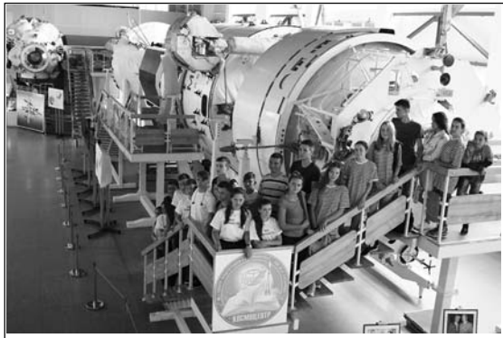
Молодежный космический центр Центра подготовки космонавтов.

ла, а внизу - длинные ряды столов с работающими компьютерами и специалистами. На мониторах мелькают загадочные параметры. МКС - это самый интернациональный проект современности, в нем участвуют Россия, США, Европейское Космическое агентство, Япония, Канада. Это самый крупный пилотируемый объект, когда-либо созданный в космосе. Он строился помодульно, по опыту станции «Мир».