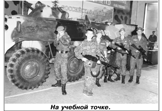
На учебной точке.

Дальнейшие мероприятия с участниками межрегионального сбора продолжались на тренировочной базе Центра подготовки космонавтов по авиационно-космической профориентации, которая состояла из