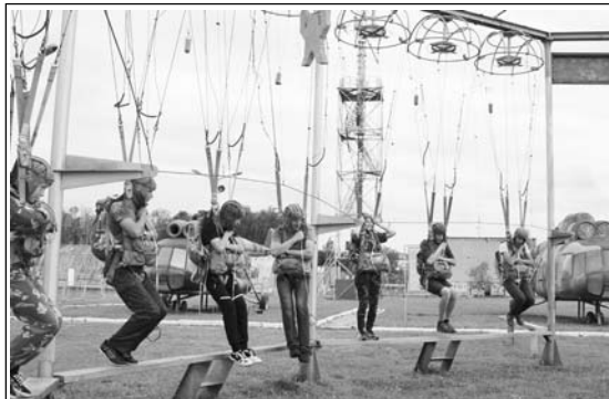
Занятие на воздушно-десантном комплексе.

- Есть ли на борту МКС юрист (мировой космический судья), который отвечает за