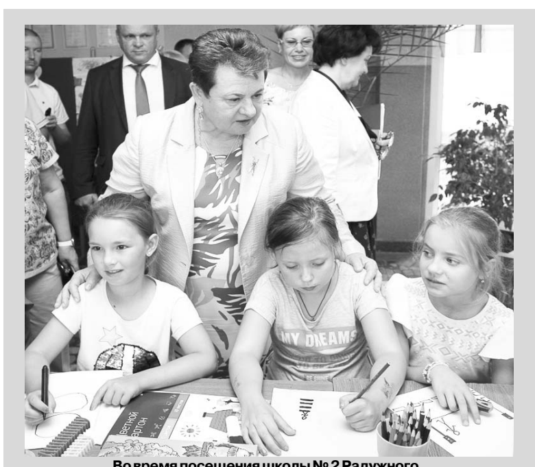
Во время посещения школы № 2 Радужного.