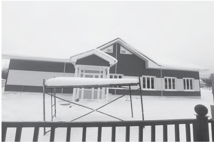
Дом культуры в посёлке Галицы Гороховецкого района

- В рамках регионального проекта «Культурная среда» профильного нацпроекта в минувшем году был построен Дом культуры в посёлке Галицы Гороховецкого района. В этом году после благоустройства территории его введут в эксплуатацию. В Вязниках начато строительство Центра культурного развития, оно будет завершено в 2024 году.