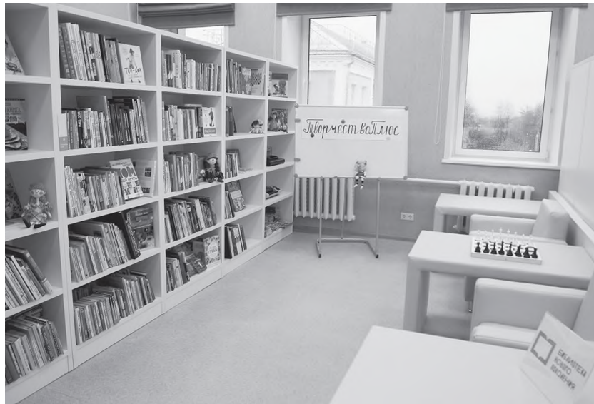
Один из обновленных читальных залов Юрьев-Польской районной библиотеки

- Центральная библиотека в Юрьеве-Польском, Пекшинская сельская библиотека в Петушинском районе и Аксёновская библиотека в Гусь-Хрустальном районе были переоснащены по модельному стандарту. На эти цели направлено 20 млн рублей.