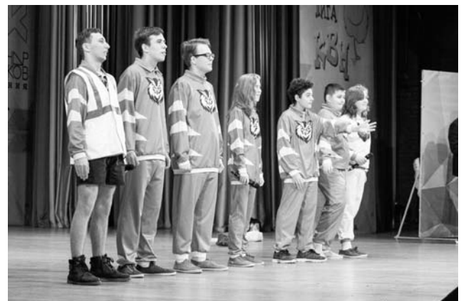
А. ОЛЕЙНИК. НА СНИМКЕ: команда «Все свои» во время выступления.

А я желаю команде КВН «Все свои» креативных творческих решений и успеха в дальнейших выступлениях!