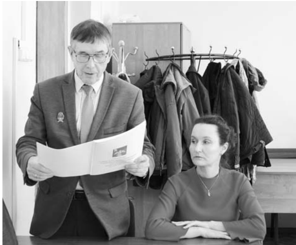
(Продолжение. Начало на 1-й стр.)

За счет уменьшения остатков средств бюджета муниципального района на 01.01.2019 года следует увеличить ассигнования в 2019 году на общую сумму 871,2 тыс. рублей по следующим объектам: на 715,4 тысячи рублей администрации Киржачского района на строительство распределительных газопроводов для газоснабжения жилых домов в сельских поселениях; на субсидии отдельным общественным организациям и иным некоммерческим объединениям в связи с увеличением количества поданных заявок от социально ориентированных некоммерческих организаций - на сумму 110,4 тыс. рублей.