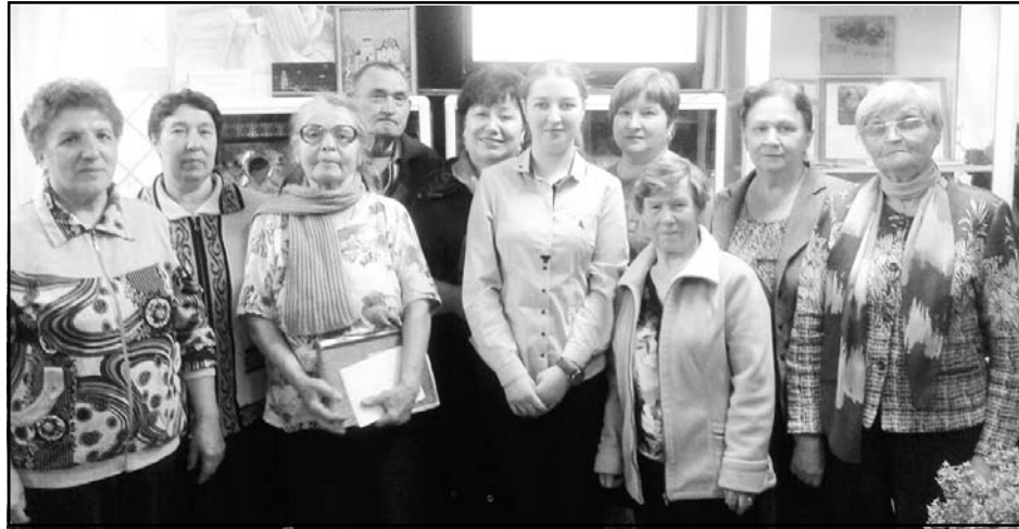
Л. ГЕОРГИЕВА, внештатный корр.

На Мемориале Ю. А. Гагарина и В. С. Серегина в рамках Международной акции «Ночь музеев» была проведена экскурсия «Под звездным небом»